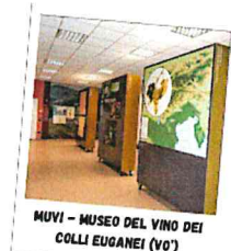
MUVI – MUSEO DEL VINO DEI COLLI EUGANEI (VO)