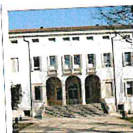
VILLA BASSI RATHGEB (ABANO TERME)