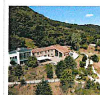
CASA MARINA (PARCO REGIONALE DEI COLLI EUGANEI)