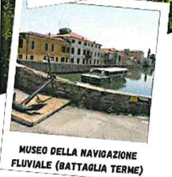
MUSEO DELLA NAVIGAZIONE FLUVIALE (BATTAGLIA TERME)