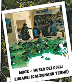
MUCE – MUSEO DEI COLLI EUGANEI (GALZIGNANO TERME)