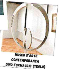
MUSEO D'ARTE CONTEMPORANEA DINO FORMAGGIO (TEOLO)