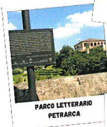
PARCO LETTERARIO PETRARCA