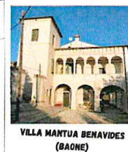
VILLA MANTUA BENAVIDES (BAONE)