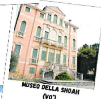
MUSEO DELLA SHOAH (VO)