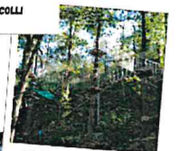
PARCO AVVENTURA LE FIRME (PARCO REGIONALE DEI COLLI EUGANEI)