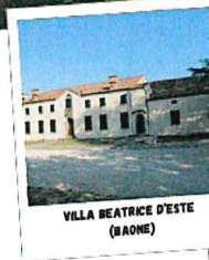
VILLA BEATRICE D'ESTE (BAONE)