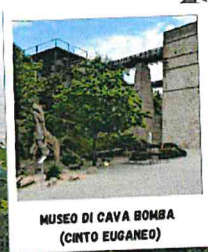
MUSEO DI CAVA BIONDA (CINTO EUGANEO)